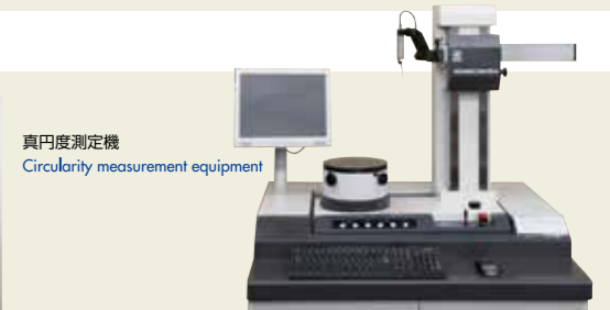
真円度測定機 Circularity measurement equipment