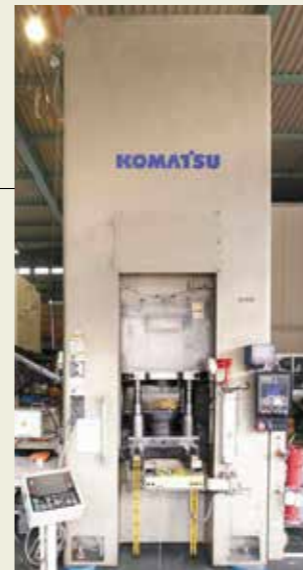
冷間鍛造プレス 630トン Cold Forging press 630tons