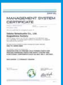
TS16949 〈品質マネジメントシステム〉認証取得