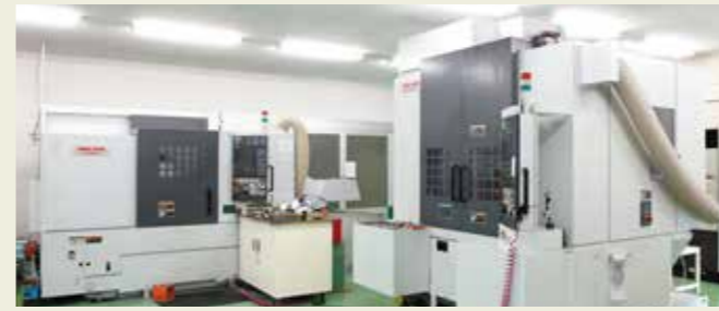
金型製作設備 Die building facilities