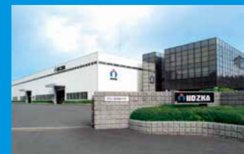
針工場 Hari Factory