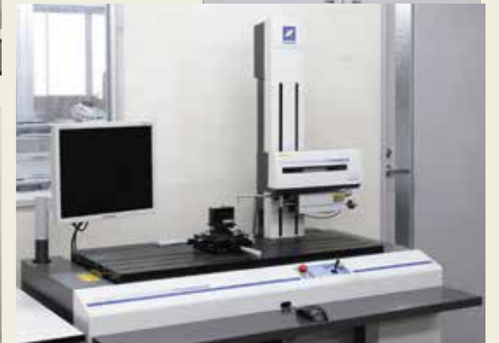
形状測定機 Form measurement equipment