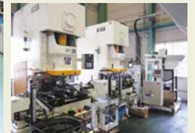
110トンプレス自動ライン Automated press line 110tons