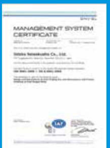
ISO9001 〈品質マネジメントシステム〉認証取得

We supply higher standards and reliable products to the customers.