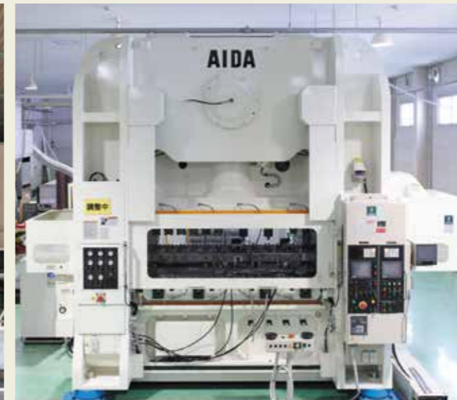
精密成形プレス 300トン Ultimate Precision Forming press 300tons