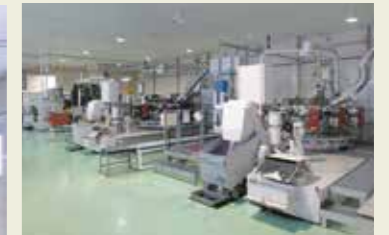
スイス製 ロータリー式トランスファーマシン Swiss made rotary transfer machine