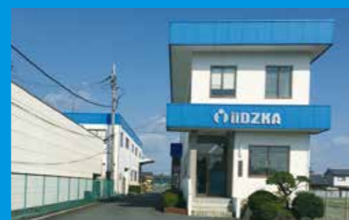
本社 Head Office

Kagoshima Factory : 3043-8, Hisasue, Kamo-cho, Aira-shi, Kagoshima 899-5307, Japan TEL: (81)-995-54-3555 FAX: (81)-995-52-0035