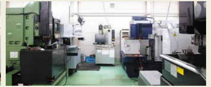
NC放電加工機 NC electro discharge machine