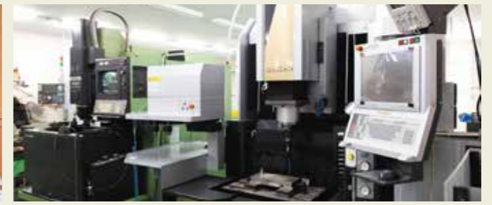
金型製作設備 Die building facilities