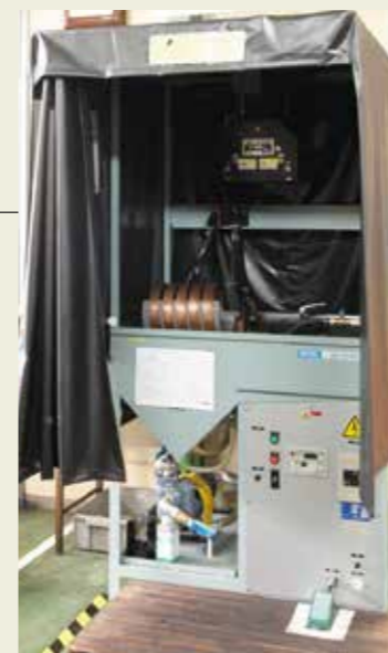
磁粉探傷装置 Magnetic measurement equipment