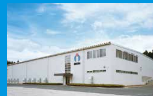
鹿児島工場 Kagoshima Factory