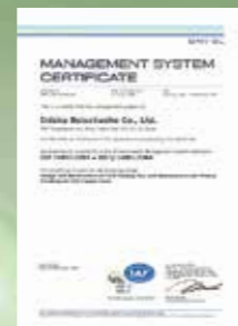
ISO14001 〈環境マネジメントシステム〉認証取得