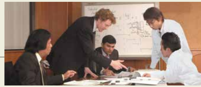
開発ミーティング Development meeting