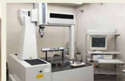
三次元測定機 3D measurement equipment