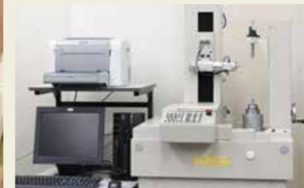
CNC全自動歯車試験機 CNC Automatic Gear Measuring Machine